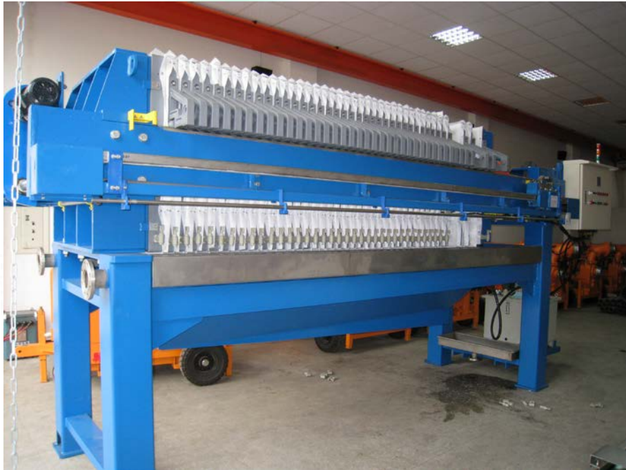
自動型板框壓濾機